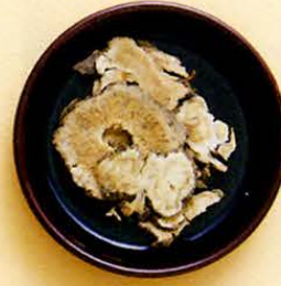
【当归(トウキ)】 血行を良くして、顔を美しくします。