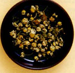
【カミツレ】 肌の炎症を穏やかに治め、メラニン色素を抑えます。