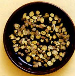
【甘草(カンゾウ)】 皮脂を整え、くすみやシミを予防します。