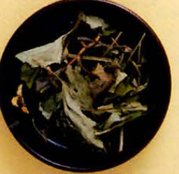
【十葉(ジュウヤク)】 別名ドクダミ。素肌を浄化して、肌に透明感を与えます。