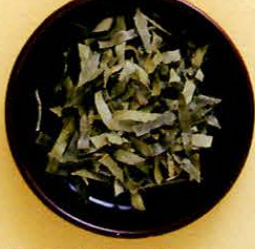
【栗葉(クリノハ)】 肌の細胞を強くし、荒れやかゆみなどを予防します。