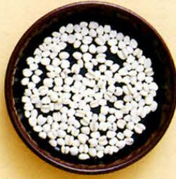
【薏苡仁(ヨクイニン)】 ハト麦です。肌をふっくらとさせ、白くします。