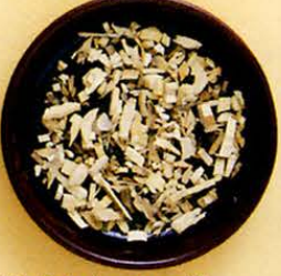
【接骨木(ニワトコ)】 傷や骨折の薬草で細胞を再生させ、吹き出物を抑えます。