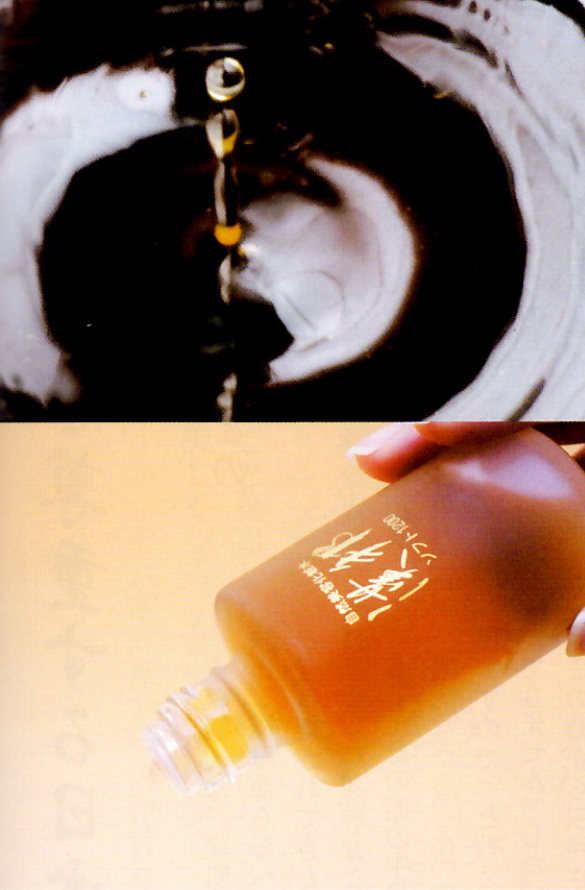
長い熟成期間をかけて作る漢方の発酵コスメ。一滴一滴が、「草根木皮」の命です。

「本来、肌は、水分が表面から逃げてみずぐに内側から補って常に適当な水分を保つようにできています。肌がカサカサするのは、自然保