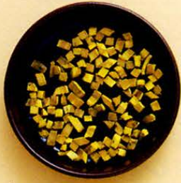
【黄柏(オウバク)】 打ち身、捻挫を癒し、肌を再生します。